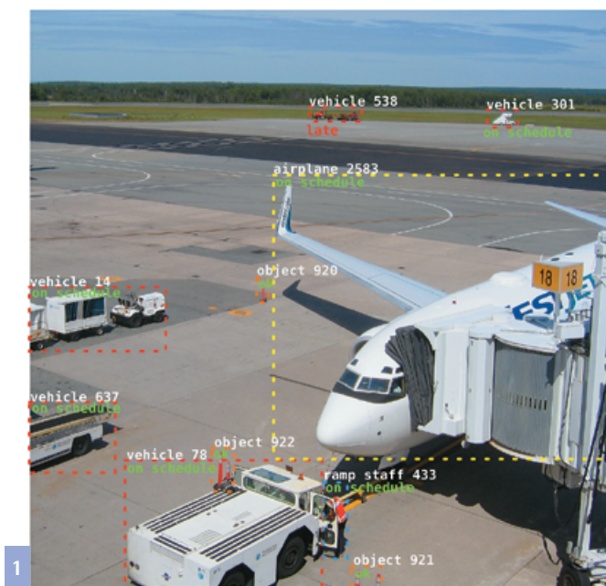
Abbildung 1 Die detaillierte Analyse des Bildinhaltes ist Voraussetzung für eine Situationseinschätzung.

Bildverarbeitungsaufgaben schon direkt nach der Aufnahme durchzuführen, besonders dann, wenn das System modular und skalierbar ausgelegt sein soll. Die Idee ist, dass die Kamera als sogenannte »Smart Camera« ausgeführt wird, das heißt, dass die Kamera statt der Rohbilddaten ein bereits ausgewertetes Bild mit Zusatzinformationen liefert. Solche Zusatzinformationen wären für das ASEV-Projekt zum Beispiel im Bild wiedererkannte Objekte. Ermöglicht wird das durch spezielle anpassbare Prozessoren (ASIPs = Application Specific Instruction Set Processors), die am Lfi durch das Institut für Mikroelektronische Systeme (IMS) für die genaueren Bedürfnisse der